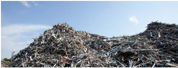
Impianto di trattamento rottame di alluminio